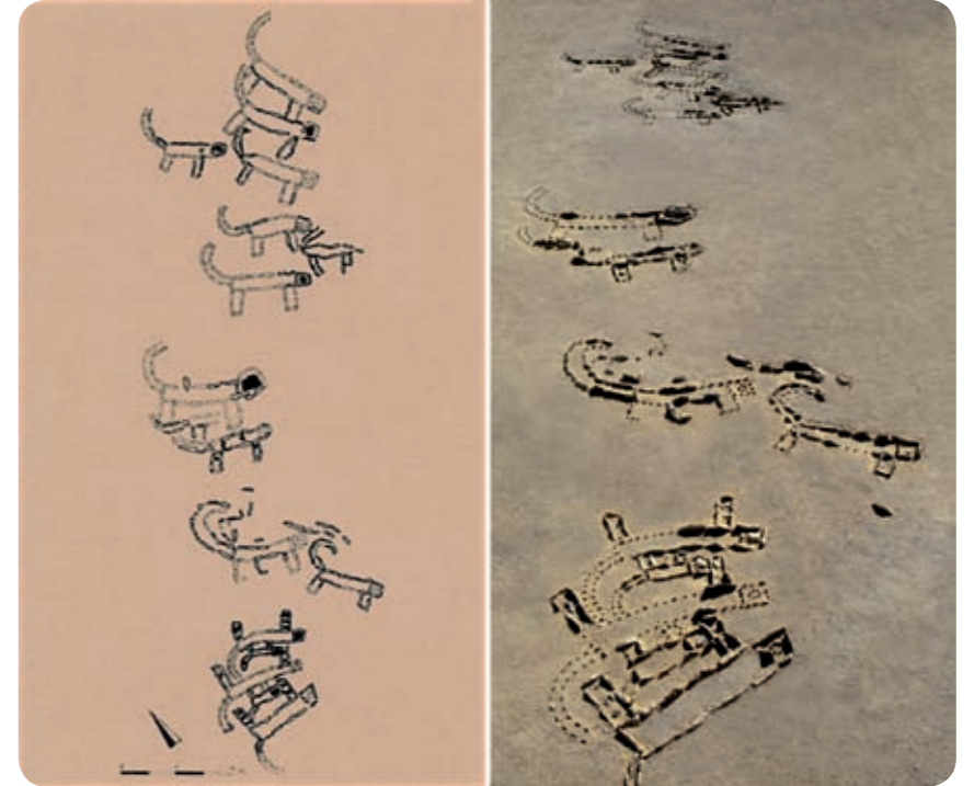
ציור הנמרים - משמאל שרטוט על פי מדידה, מימין צילום לאחר השיקום

עולה השאלה מה פשרם ומה תפקידם של בעלי החיים? ראשית, אפשר לומר כי באמנות העתיקה בכללה היה לבעלי החיים ערך סמלי, פולחני. שנית, נראה כי בבקעת עובדה נוצרו בעלי החיים במהלך טקסים פולחניים, תוך שימוש חוזר באבנים קיימות. זאת על פי השרידים המעטים של כמה מבעלי החיים והעובדה שכמה מהם נחתכים על ידי אחרים. מעבר לכך, מעט מתוכנם הסמלי של בעלי החיים אפשר לפענח בעזרת השוואות לאמנות עתיקה מרחבי המזרח הקדום. הפירוש הסביר ביותר הוא שבעלי החיים מסמלים אלים וזאת מכמה נימוקים: ראשית, ייצוג אלים בדמות בעלי חיים היה מקובל מאד במזרח, ולדוגמה, לכל אל במצרים הייתה דמות אנושית, דמות של בעל חיים מסוים וגם דמות מורכבת משניהם. שנית, כל הנמרים פונים מזרחה (למזרח חרפי - לנקודת הזריחה של השמש בחורף) בדומה לכיוון השולט במצבות, במקדשים הפתוחים, ומאוחר יותר גם במקדשים הבנויים. ושלישית, בכל בעל חיים שבו השתמרה העין, היא תופסת את רוב שטחו של הראש, והדבר בולט ביותר בנמר האמצעי, שבו העין היא אבן צור כהה שקוטרה יותר מ-30 ס"מ. עיניים גדולות, הרואות הכל, מופיעות לעיתים קרובות בתיאורי אלים מתקופות שונות.