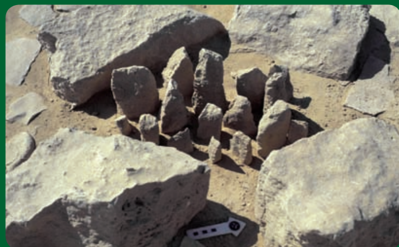
מקדש הנמרים - שש עשרה מצבות אבן קטנות במרכז התא כפי שהתגלו בחפירה

בפינה המערבית של החצר במקדש הנמרים נבנה תא מאורך ששימש כקודש קדשים, ובמרכזו קבוצה של 16 מצבות אבן קטנות. מצבות אבן בלתי מעובדות, קטנות או גדולות, ידועות במקומות רבים בעולם ואף בחברות מסורתיות בנות זמננו. הן מייצגות אלים או אבות קדמונים והן נתפסות כמכילות בתוכן את רוחם ואת כוחם של האלים והאבות. בעוד שבשאר המזרח התיכון אלים ויצגו בפסלים, בדמויות אדם או בבעלי