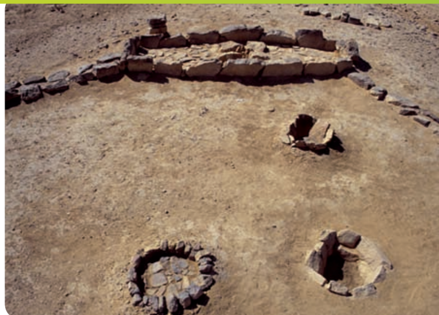
מקדש הנמרים - התא ששימש כקודש קדשים ושלושה מזבחות לפניו בחצר המקדש