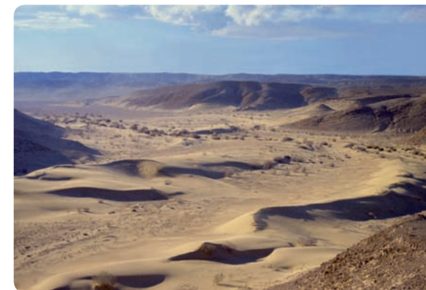
דיונות של חול גירני בנחל כסוי, צפון מזרח בקעת עובדה

בעונות הזריעה והקציר. לאחר הקציר הם חוזרים לעקבה עם היבול הנדוש" (Musil, A. 1926. The Northern Hegaz. New York). מוסיל כתב זאת בתוך דיון על תושבי עקבה, אך למעשה עיקר העיבוד התבצע על ידי הבדואים עצמם.