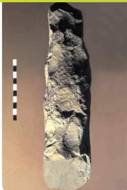
חוד של מחרשת אבן מבקעת עובדה, הקדום ביותר שהתגלה בעולם

כתב וצילם: עוזי אבנר, ארכיאולוג, מכון הערבה ללימודי סביבה ומרכז מדע ים המלח והערבה