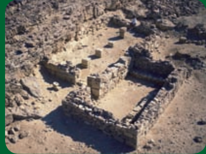
בנין המועצה האזורית במזרח בקעת עובדה, מן התקופה הנבטית