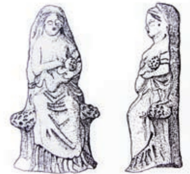
פסלון אבן מהתקופה ההלניסטית - אלה יושבת על כסא נמרים ומיניקה תינוק בעל ראש מנומר